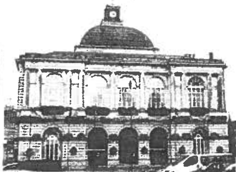
L'hôtel de ville de Saint-Omer